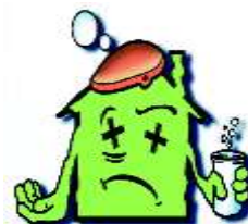
dégradation du logement (humidité, moisissures)

A fin de vous prémunir contre tous ces désagréments et d'éviter les pathologies consécutives à une ventilation insuffisante (odeurs, moisissures, décollement des papiers peints, apparitions d'auréoles humides, condensation sur les murs...), pensez, dès à présent, à prévoir des entrées d'air (dimensionnées et positionnées selon le cahier du CSTB et la fiche technique de l'UF PVC, et, conformes à la réglementation en vigueur) sur vos nouvelles fenêtres dans les pièces principales qui doivent être en adéquation avec les caractéristiques d'isolation acoustique de vos fenêtres.