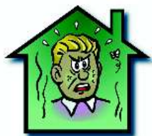
Troubles liés à l'inconfort (santé, comportement)

E n revanche, le remplacement des fenêtres anciennes qui laissaient passer l'air par des fenêtres neuves étanches risque de déséquilibrer la ventilation naturelle de votre logement.